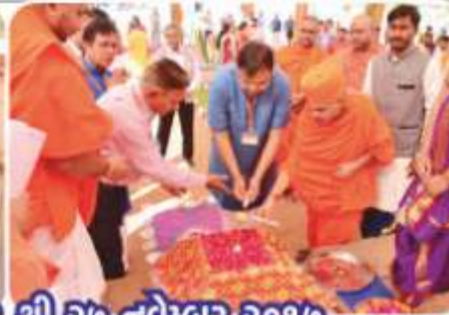
મૂર્તિપ્રતિષ્ઠા મહોત્સવ - કલોલ, (પંચવટી)ના દર્શન તા. ૨૧ થી ૨૭ નવેમ્બર ૨૦૧૭