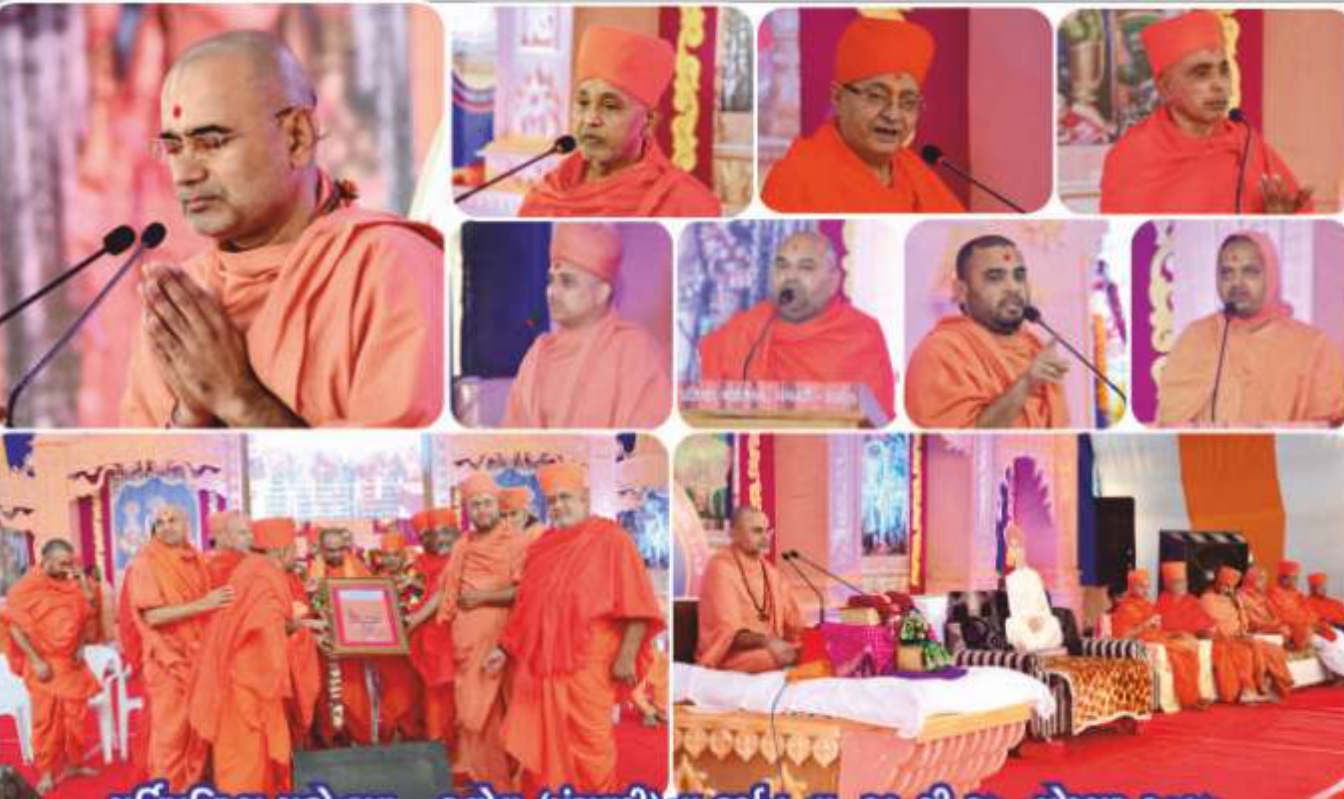
મૂર્તિપ્રતિષ્ઠા મહોત્સવ - કલોલ (પંચવટી)ના દર્શન તા. ૨૧ થી ૨૭ નવેમ્બર ૨૦૧૭