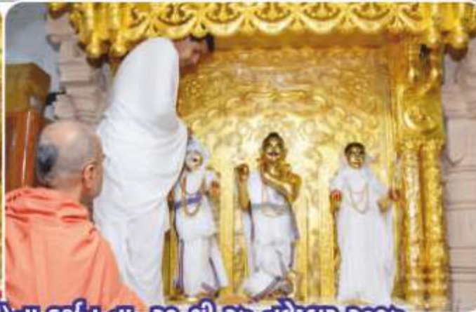
भूर्तिप्रतिष्ठा महोत्सव - डबोल (पंचवटी) ना दर्शन ता. २१ थी २७ नवेम्बर २०१७