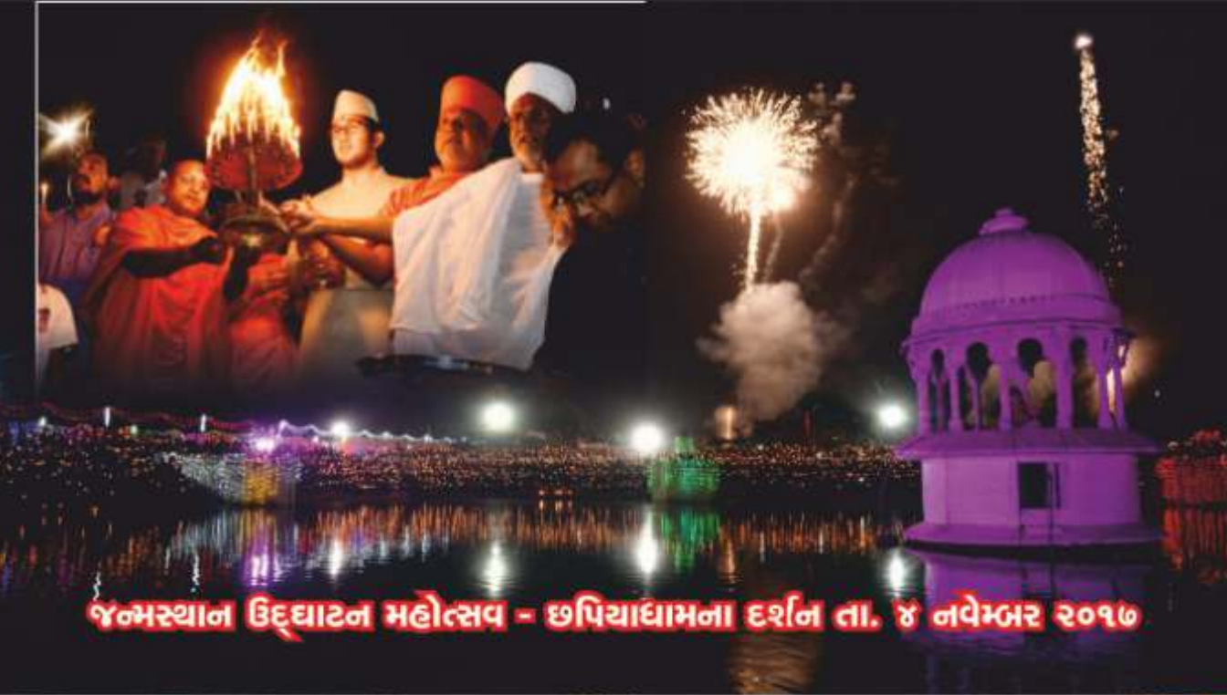
જન્મસ્થાન ઉદ્ઘાટન મહોત્સવ - છપિયાધામના દર્શન તા. ૪ નવેમ્બર ૨૦૧૭