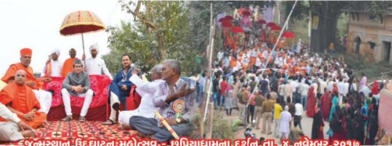
જુનમસ્થાન ઉદ્ઘાટન મહોત્સવ - છપિયાધામના દર્શન તા. ૪ નવેમ્બર ૨૦૧૭