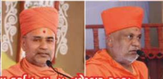
જન્મસ્થાન ઉદ્ઘાટન મહોત્સવ - છપિયાધામના દર્શન તા. ૪ નવેમ્બર ૨૦૧૭