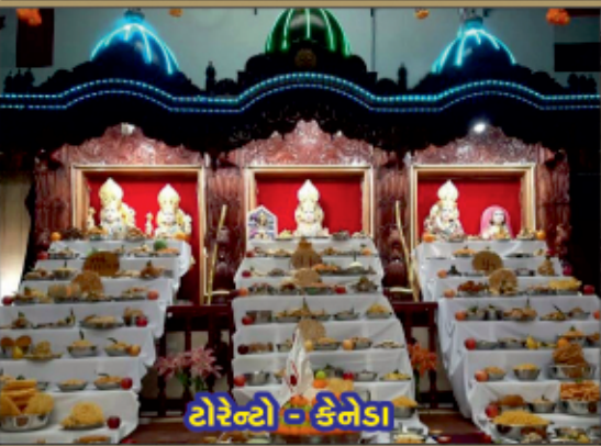
ટોરોન્ટો - કેનેડા