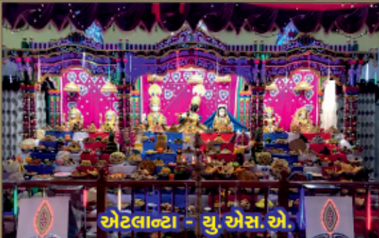
એટલાન્ટા - યુ.એસ.એ.