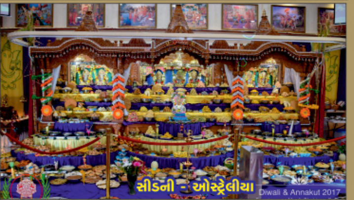
સીડની - ઓસ્ટ્રેલીયા