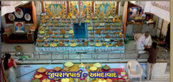
જુવરાજપાર્ક - અમદાવાદ