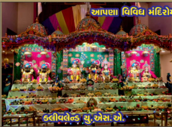
આપણા વિવિધ મંદિરોમાં દિવાળીના અભૂક્ત દર્શન