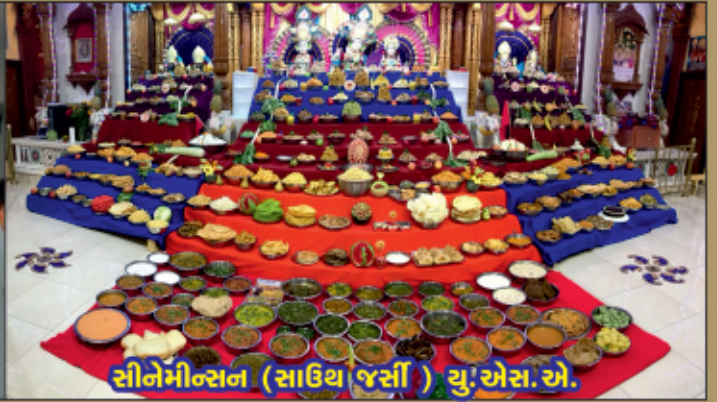
સીનેમીન્સન (સાઉથ જર્સી ) યુ.એસ.એ.