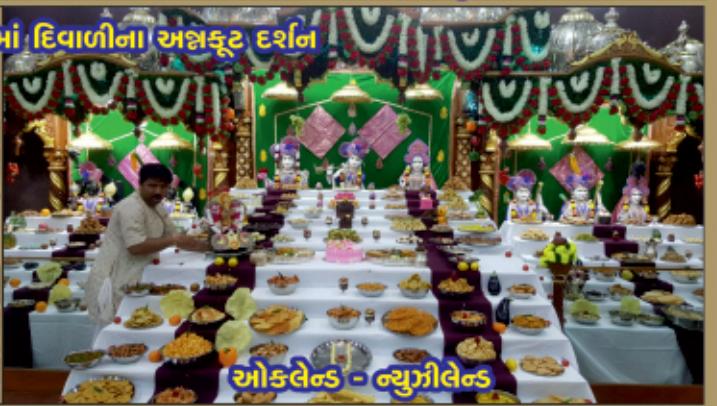
ઓકલેન્ડ - બ્યુગીલેન્ડ