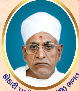
કોઠારી પાર્થદર્વજી જાદવજી ભાવ