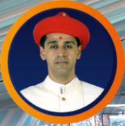
પ.પૂ.ધ. ૧૦૦૬ આચાર્યશ્રી કીશલેન્દ્રપ્રસાદજી મહારાજ